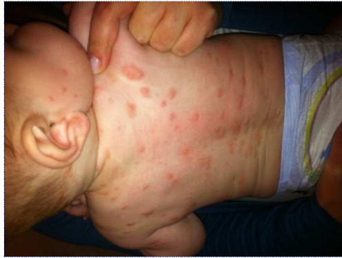
Eczema nummulare del neonato

L'eczema nummulare è anche una forma che si ritrova nel neonato con delle lesioni discoidi. Sembra essere ribelle a coloro che non osano associare i dermocorticoidi a degli emollienti. Un peccato per il neonato !