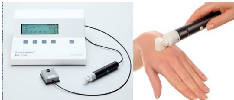
Apparecchiatura per la misurazione della perdita d'acqua transepidermica